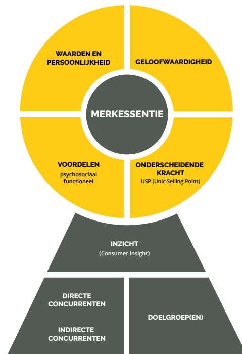
Het Artline Branding Model met de vragen voor het bepalen van de merkessentie

Na het bepalen van de strategie wordt er door Artline een marketingcommunicatieplan opgesteld. Het totale plan bestaat verder uit een creatief concept en de daarbij behorende communicatiemiddelen. De reeds bestaande communicatiemiddelen worden getoetst aan de hand van de nieuwe merkessentie.